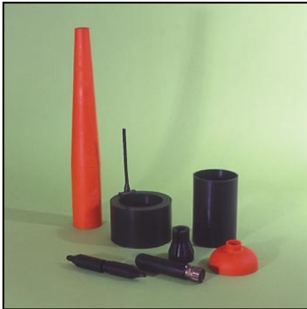
Gekapselte und Formprodukte

Marktführer für elektromechanische Formprodukte und Nebensysteme für Unterwasserprojekte